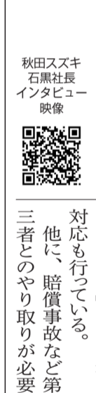
秋田スズキ社長 石黒太朗氏 インタビュー映像

日本人が一生のうちでがんと診断される確率は、男性62.1%、女性48.9%。多くのメディアで「2人に1人ががんになる時代」と取り沙汰されている。こうした背景があり注目されているのが「がん防災」だ。突